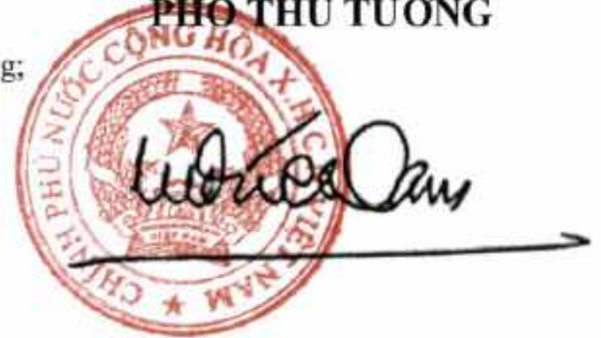
Vũ Đức Đam

TM. CHÍNH PHỦ KT. THỦ TƯỚNG PHÓ THỦ TƯỚNG